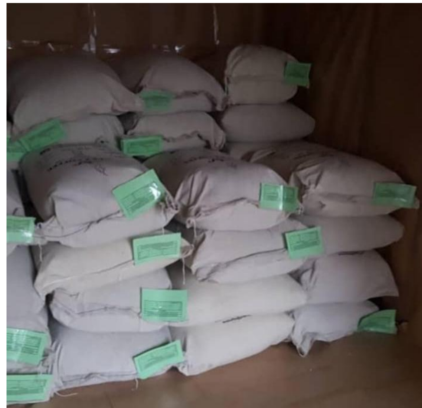
Secondary - Packaging