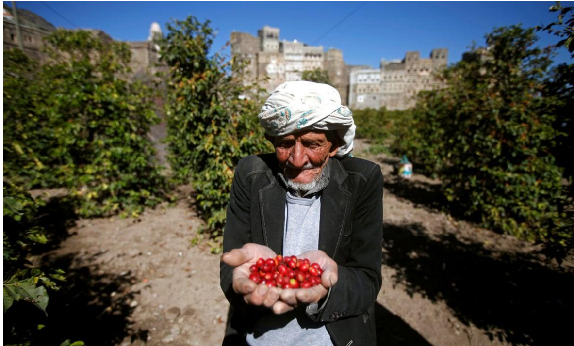
Primary - Coffee Farming