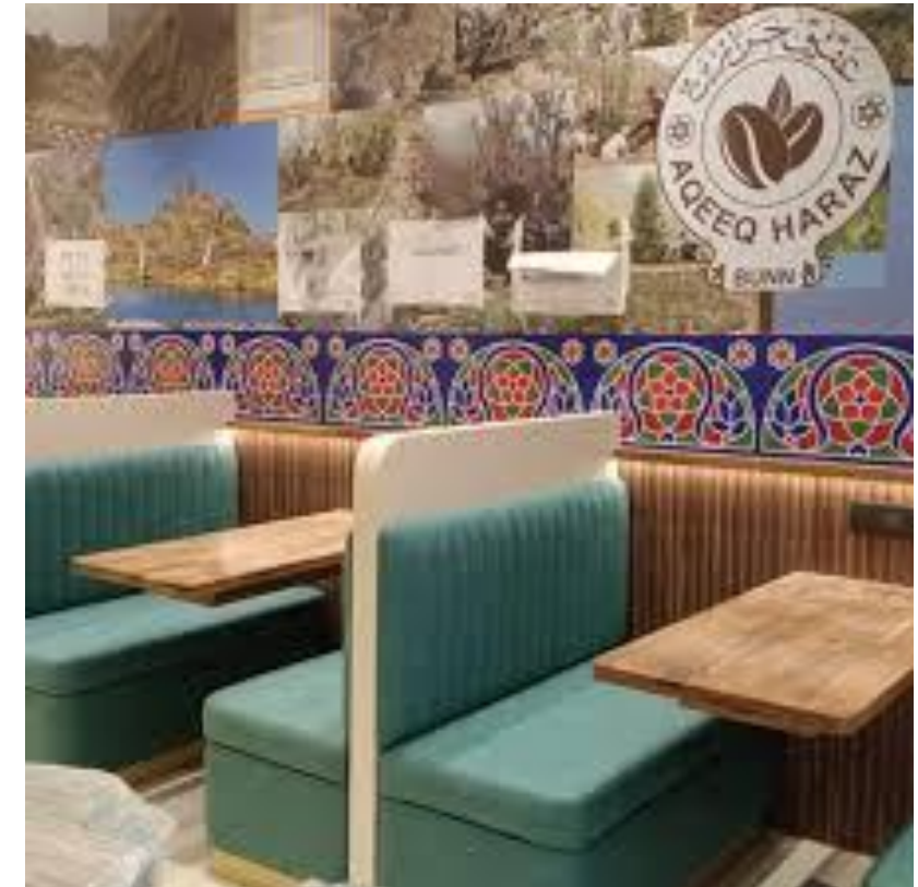
Tertiary- Aqeeq Haraz Bunn Café in Surat